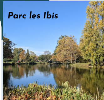
Parc les Ibis

Renseignements : gpicot93@free.fr ou 06 07 97 74 00